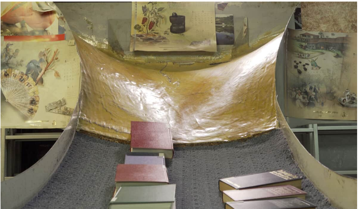
הדסה גולדויכט, פתיחה ומחיקה, 2024. מתוך התערוכה "ביבליוסקופיה", מוזיאון ישראל

הרומן של גולדויכט עם הספרייה הלאומית ארוך שנים, ובשנים האחרונות, ערב התרוקנות הספרייה ומעברה לבניין החדש, החלה גולדויכט לצלם ארוכות במרתפיו של הבניין הישן של הספרייה. בעקבות תהליכים רפואיים שעברה תוך כדי שנות הצילומים, גולדויכט החליטה להתייחס למרתפי הספרייה כאל חלל פנימי של גוף אנושי, ולהתמודד איתו בכלים של בדיקות רפואיות מודרניות. ואם הרפואה היום נוהגת להחדיר מצלמות ומכשירים רפואיים שונים לתוך גוף האדם – למערכת העיכול, לעורקים – כדי לנסות להבין ולפתור בעיות בו, אז גולדויכט בחרה להכניס את המצלמות שלה לתוך מערכות התנועה של הספרייה, המערכות שמובילות את הספרים ממקום למקום, ו"לבדוק" אותן. בשלוש מתוך ארבע עבודות הווידאו שבתערוכה, המצלמה של גולדויכט פועלת כאחד הספרים שבמחסן: היא נוסעת על מסוע הספרים שנמתח לאורך התקרה, היא עולה ויורדת במעלית המשא הקטנה שהובילה את הספרים לאולמות והיא יוצאת לטיול ארוך, ברוורס, על גבי עגלת ספרים ששימשה את הספרנים לקחת ולהחזיר ספרים מהמדפים. המסך הרביעי הוא היחיד שמצולם שלא מנקודת מבטו של ספר נע. המצלמה בו סטטית והתנועה היא של הספרים המגיעים לסיומו של המסוע ונופלים בחבטה אל אזור האיסוף שלהם.